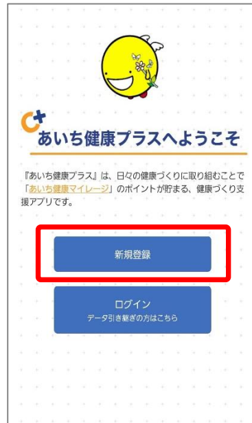
③あいち健康プラスを再度開いていただき、初期画面が表示されたら『新規登録』を選択します。