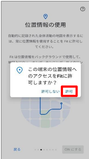
⑤位置情報のアクセス許可のダイアログが表示されたら『許可』を押します。