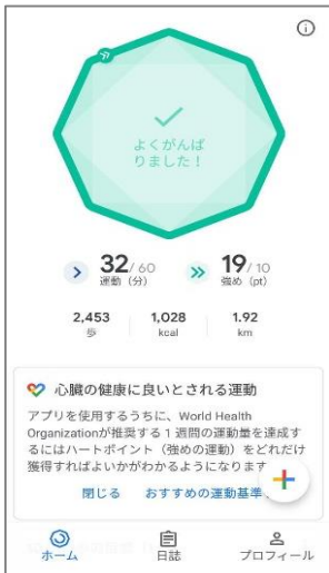
⑦ホーム画面に遷移して、Google Fitの登録が完了です。